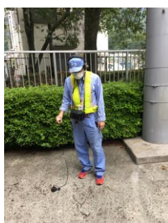
夜間水道管路調査