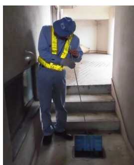
水道メーター付近漏水調査

【特記】 箱根水道センターでは上記以外の地区でも年間を通して漏水調査（深夜調査を含む）を実施しています。